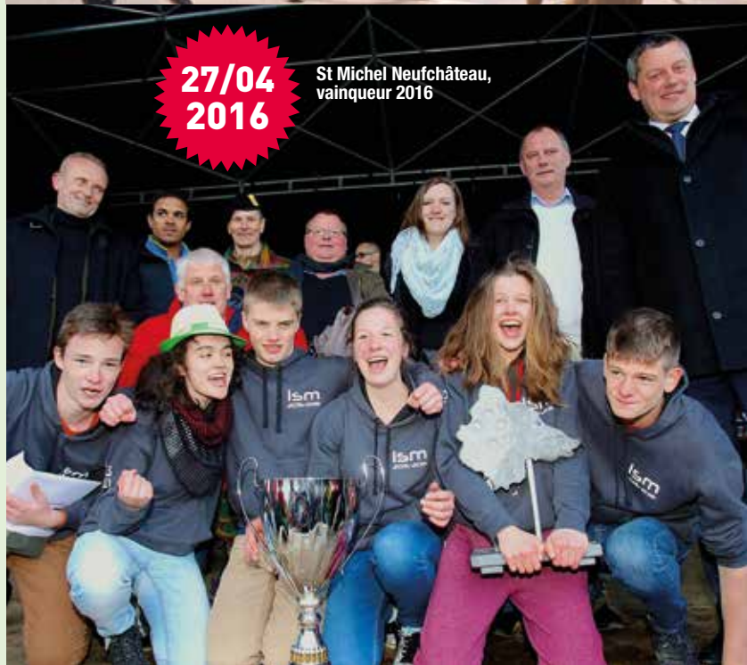
St Michel Neufchâteau, vainqueur 2016